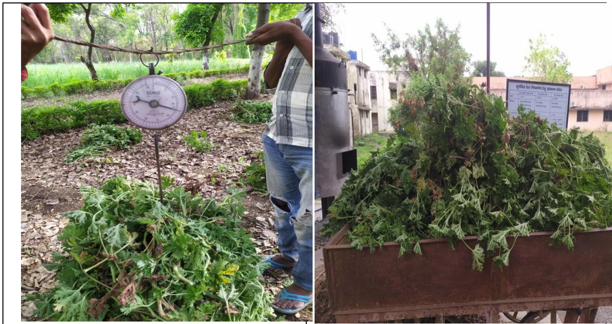
जेरेनियम की हर्बेज उपज का मापन