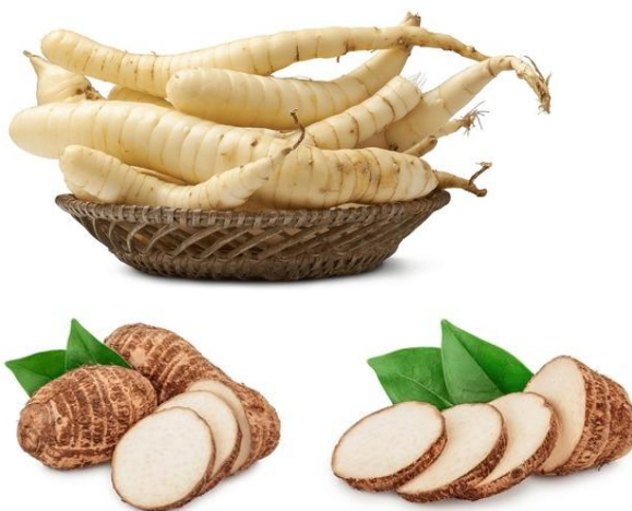
चित्र: अरारोट का प्रकंद और प्रकंद के टुकड़े