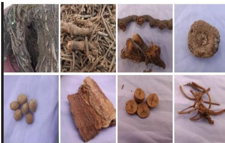
चित्र: १. वन उत्पाद