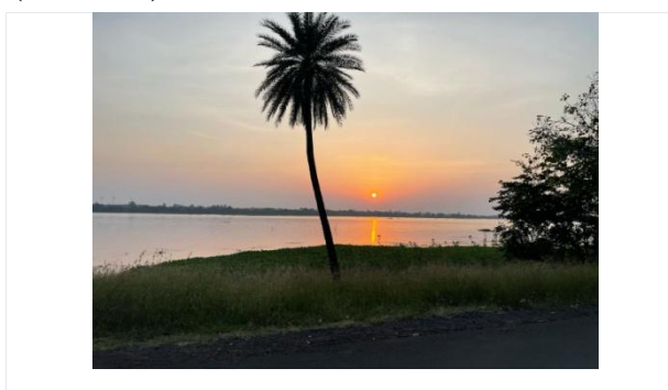
सनसेट पॉइंट (वन बिहार नेशनल पार्क, भोपाल)