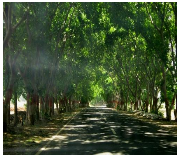
Fig. 1. Roadside trees along Amarkantak–Pendra route with Sal and Teak dominance.