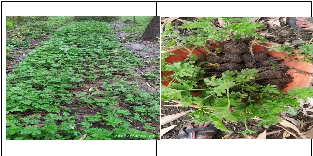
20 दिनों के बाद जेरिनियम का प्रदर्शन