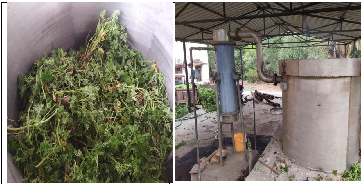
आसवन के लिए तैयार जरेनियम हर्बेज