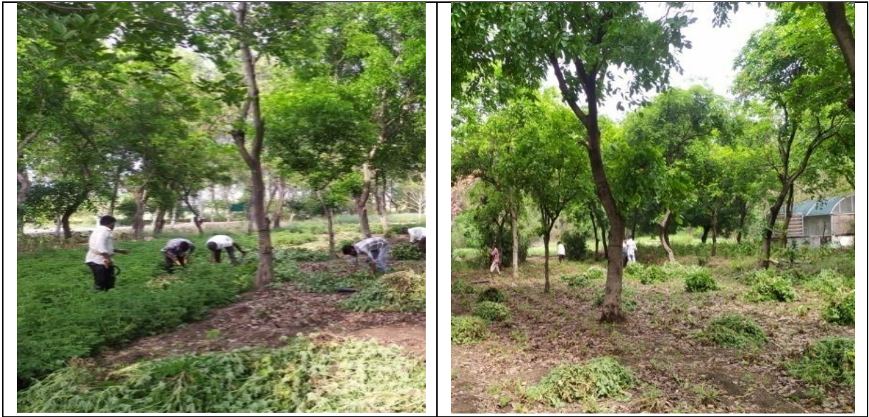
जेरेनियम की कटाई