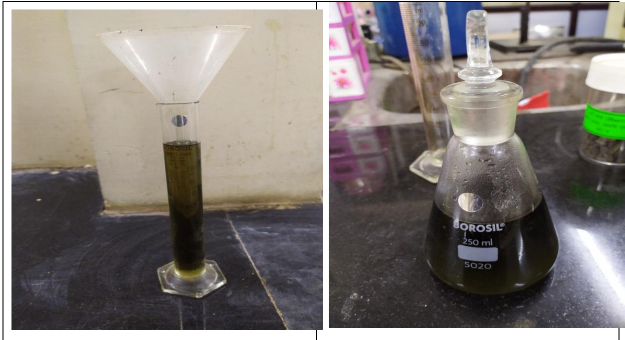
जरैनियम तेल का मापन