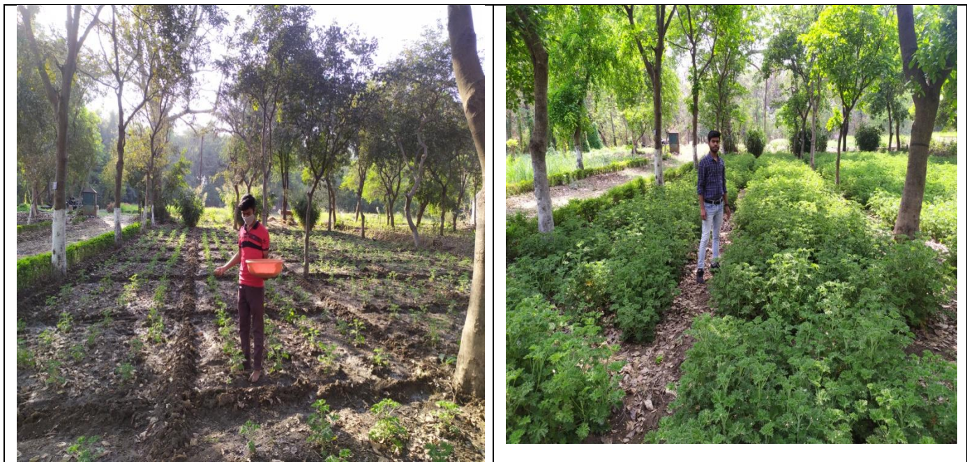
जरिनियम खेत में उर्वरक डालते हुए