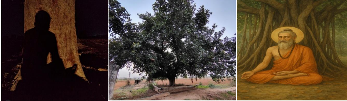
Fig: A tree therapy under F. benghalensis

banyan tree served both as a physical retreat for spiritual practices and a symbolic bridge between heaven and earth, body and spirit, time and eternity.