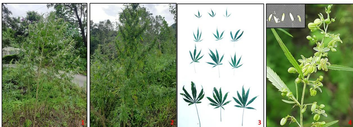
Figure 01: Morphological features of Cannabis plant — (1) Male plant, (2) Female plant, (3) Variation in leaves with 3, 5, 7, and 9 leaflets, (4) Male inflorescence showing anthers.

However, Cannabis is currently mainly vegetative propagated to ensure consistency in cannabinoid contents and profiles of the harvested biomass or resin. As an allogamous species, there is variability in the quality and quantity of biomass obtained, thus it is preferable to eliminate male and cultivate only female plants to maximize cannabinoid potential and maintain consistency in production.