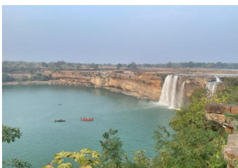
चित्रकूट जलप्रपात (छत्तीसगढ़)