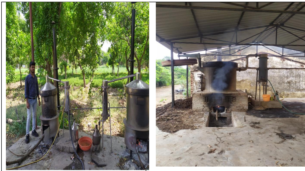
जरेनियम तेल आसवन प्रक्रिया